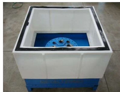
FIG.6) POSIZIONARE LA GUARNIZIONE 1200X1200 SOPRA LA BASE DEL POZZETTO E' VIETATO TASSATIVAMENTE L'UTILIZZO DI SILICONI O ALTRO