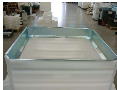
FIG.11) POSIZIONARE IL RINFORZO ALL'INTERNO DELLA PARTE SUPERIORE, ESEGUIRE N.2 FORI OGNI LATO E FISSARE CON LA BULLONERIA DATA IN DOTAZIONE