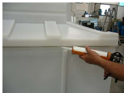
FIG.10) CHIUDERE CON APPOSITO SIGILLANTE L'ACCOPIATURA TRA BASE E PARTE SUPERIORE DEL POZZETTO