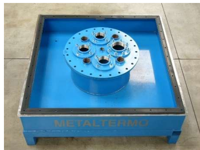
FIG.2) APPOGGIARE SULLA FLANGIA DEL SEMIPOZZETTO LA GUARNIZIONE 1200X1200 E' VIETATO TASSATIVAMENTE L'UTILIZZO DI SILICONI O ALTRO