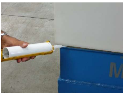
FIG.9) CHIUDERE CON APPOSITO SIGILLANTE L'ACCOPIATURA TRA SEMIPOZZETTO SERBATOIO E BASE POZZETTO